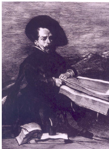
"El Primo". El Grabador al Aguafuerte. Vol. III. Estampa XX. Quinta entrega. Madrid. 1876.

El Primo ó el Enano, escribano Diego de Acedo es una estampa al aguafuerte y aguatinta con una huella de 279 X 218 mm. En dicha obra aparece el bufón Diego de Acedo sentado en el campo hojeando infolios, alimento quizá de manías nobiliarias.