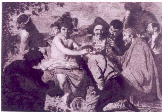
"Los Borrachos". El Grabador al Aguafuerte. Vol.III. Estampa XXIV. Sexta entrega. Madrid. 1877.

una copa de vidrio, corona con una hoja de vid a un bebedor. Rodeándolos, hay otro coronado y otros cuatro que esperan serlo y uno que se acerca al grupo.