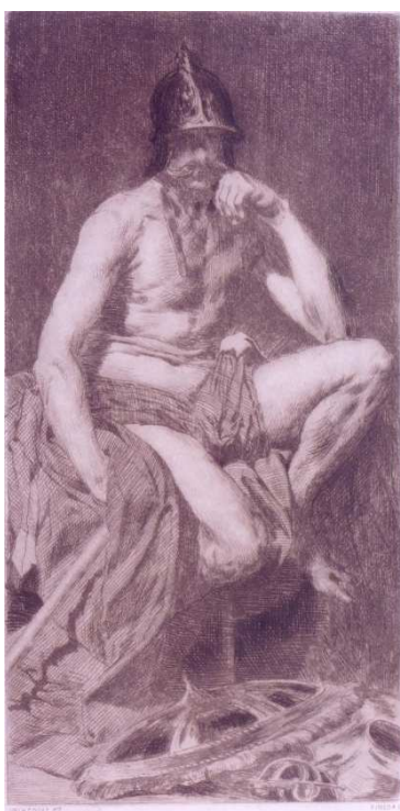
Marte. El Grabador al Aguafuerte. Vol. III. Estampa IV. Primera entrega. Madrid. 1876.

Por orden cronológico la estampa de Marte es la primera. Está realizada con la técnica del aguafuerte con una huella de plancha de 265 X 134 mm. En la obra aparece Marte sentado y desnudo con morrón, paño arrebujado en el vientre y manto que cae al suelo. A su pié el escudo y otras piezas de armadura.