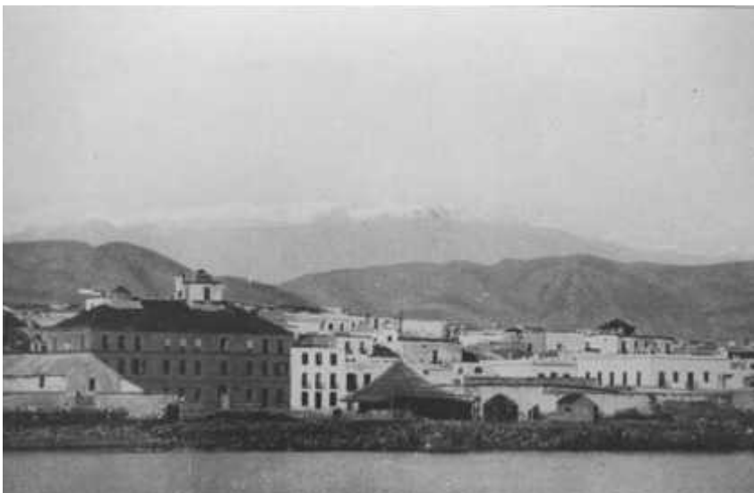
Imagen de San Andrés. Al fondo la famosa Sierra de Gador