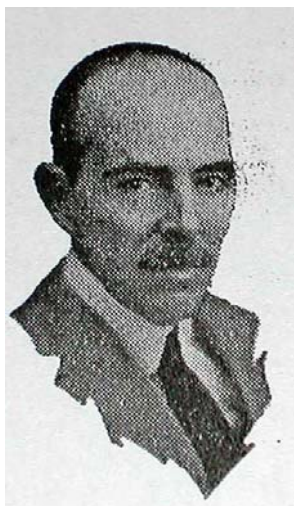
Retrato de Francisco Cuenca Benet

En noviembre de 1913 Francisco Cuenca emigra a Cuba, donde continúa con su actividad de escritor y periodista. Publica "Hampa Habanera" (Nueva Orleans 1914), "Aranceles de Aduanas de Cuba" (La Habana 1915) "Nuevos Aranceles de Aduanas de Cuba" (La Habana 1927) y "El Tratado de Comercio entre Cuba y España" (1928).