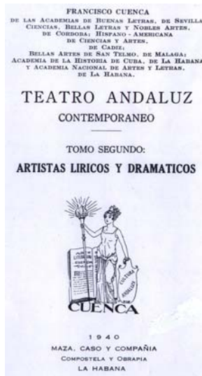
Portada interior de Artistas Líricos y Dramáticos . 1940.

Tras este libro, la última obra de la Biblioteca de Divulgación Andaluza, obra póstuma sin publicar, terminada en 1943, el mismo año de su muerte se titula " Ciencia Andaluza ".